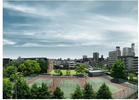
《建物南面に広がる爽快なワイドビュー》